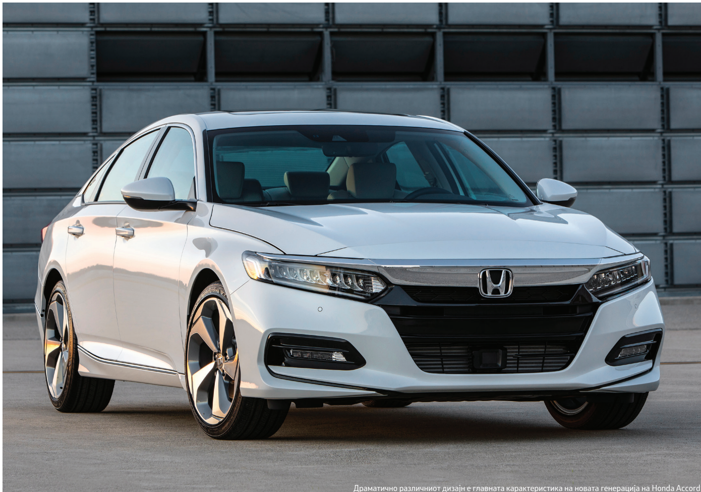
Драматично различниот дизајн е главната карактеристика на новата генерација на Honda Accord