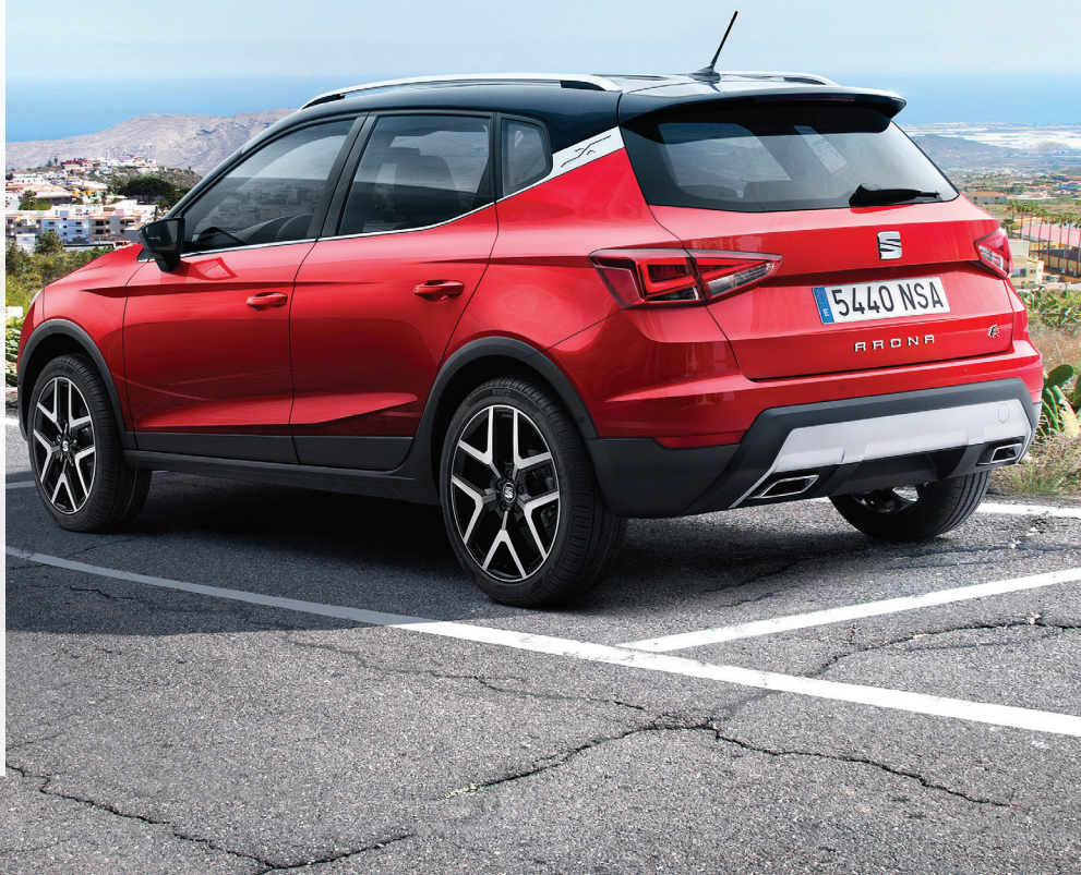
Arona е вториот кросовер модел на Seat

Должината од 4,14 метри ја истакнува урбаната намена на Arona, а за просторноста на ентериерот сведочи висината за 10 сантиметри поголема од онаа на Ibiza. Јасно е дека комфорот е за класа подобар, а целокупниот впечаток го дополнува багажникот од литри. Основната опрема ќе биде збогатена и со додатоците за уживање во возењето и со оние безбедносните.