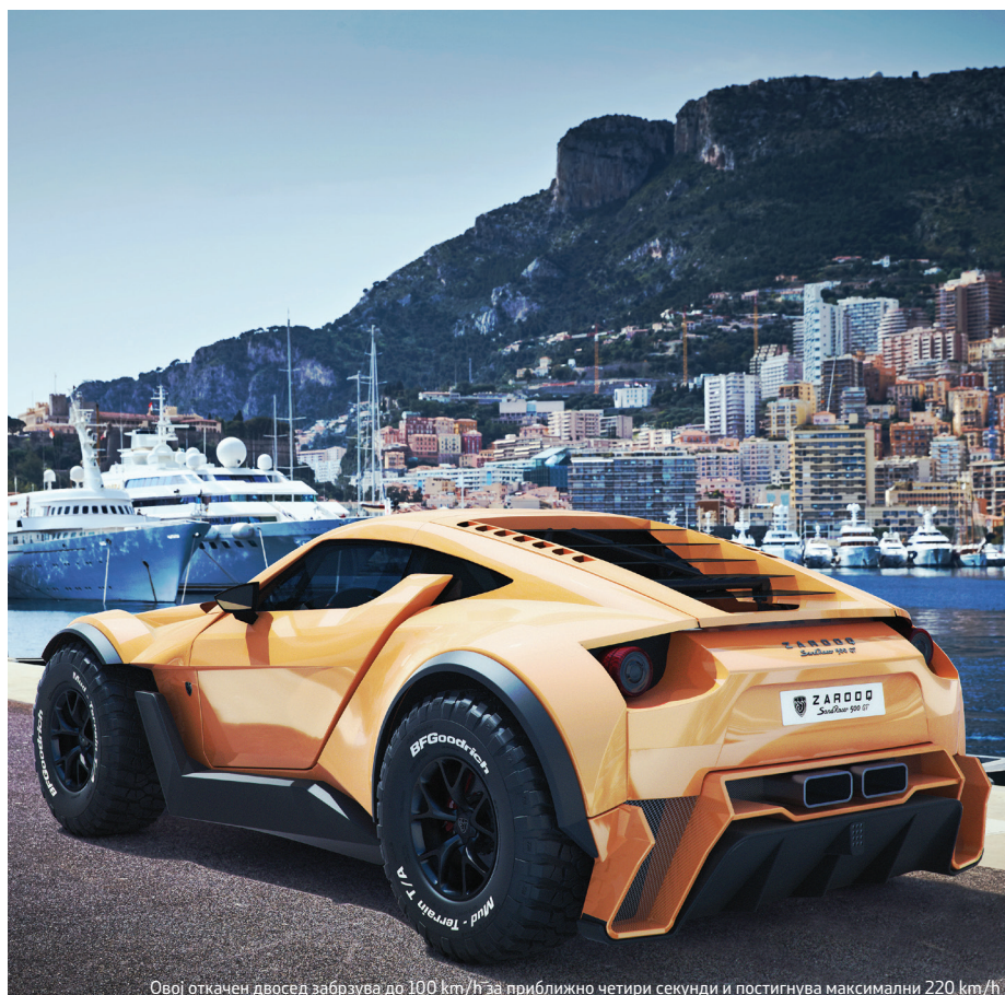
Овој откачен двосед забрзува до 100 km/h за приближно четири секунди и постигнува максимални 220 km/h

Пред две години, светот го обиколи една вест која беше игнорирана – во Емиратите беше најавено раѓањето на новата автомобилска марка Zarooq Motors. Беше познато и името на нивниот модел – SandRacer, а концептот најавуваше бесно баги во кое, на арапски својствен начин, се искombинирани луксузот и брзината. За овој модел, сега подготвен за производство, се знае повеќе и веќе не смее да се игнорира. Не ни може, бидејќи првата бројка која љубопитниот поглед ќе ја сретне е 525, колку што коњски сили развива централно поставениот 6,2 литарски V8 мотор. Последната е 450.000, која ја изразува цената во американски долари. Меѓу нив уште ќе се сретне и тежината од 1.200 килограми постигната благодарение на каросеријата од јаглородни влакна. Тука е и тркачкото потпирање со клиренс од 45 сантиметри, со опција за негово регулирање во зависност од теренот по кој се вози, а секвенционалниот петстепен менувач и покрај теренскиот изглед ја пренесува силната само на задните тркала, што не е случајно, бидејќи на тој начин пустинската забава е брутално загарантирана.