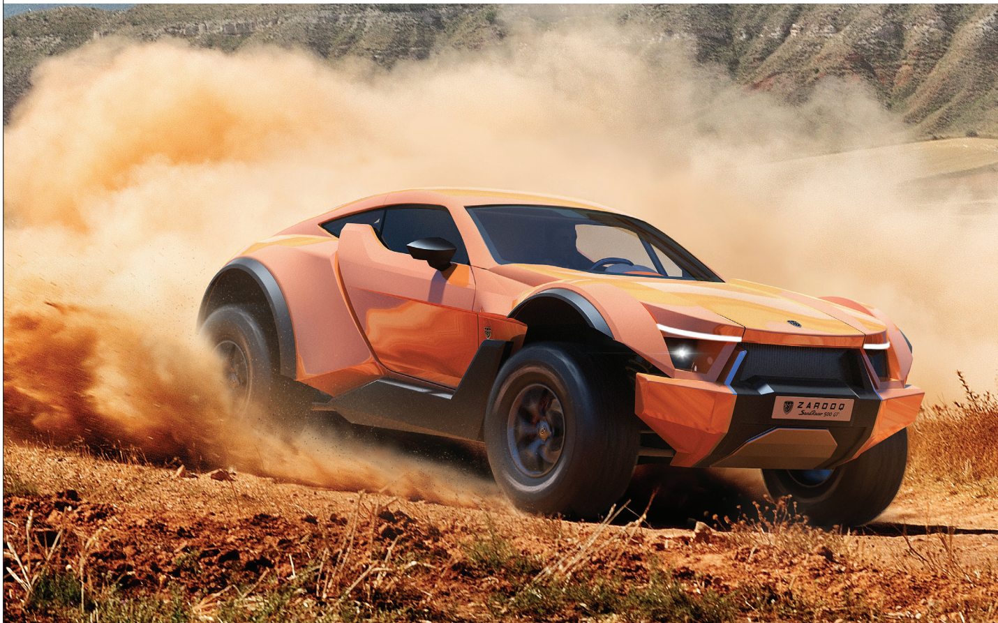
Zarooq Motors SandRacer 500 GT