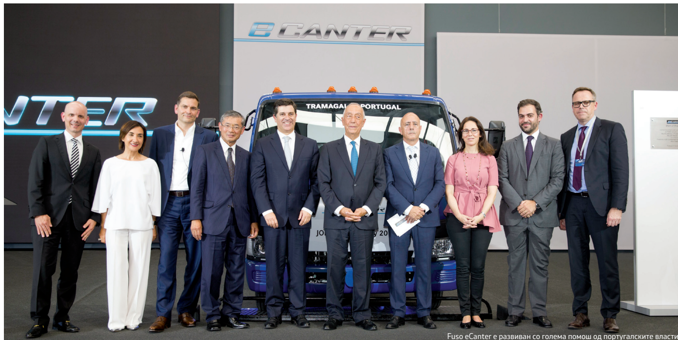
Fuso eCanter е развиван со голема помош од португалските власти