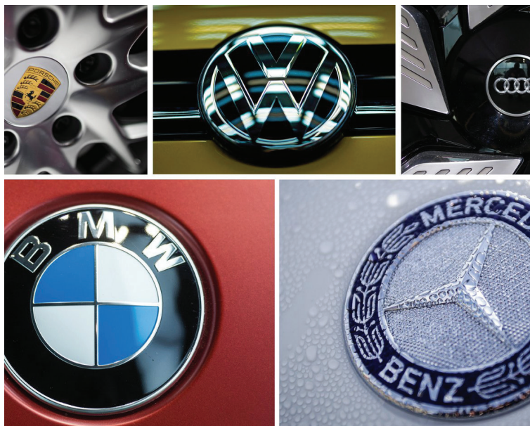
Пет големи германски производители на автомобили со години се договарале како да настапуваат на пазарот

Германските медиуми изнесоа сериозни обвинувања на сметка на домашната автомобилска индустрија. Според нив, тие наводно со години тајно се состанувале и договарале за своите постапки против заедничките конкуренти. Картелот дејствувал уште од деведесеттите години и го сочинувале германски автомобилски производители: Audi, BMW, Mercedes, Porsche и Volkswagen. Се наведува дека во 60-ина работни групи биле вклучени околу 200 лица. Сите тие меѓу другото редовно ги договарале и техниките, цените и пристапот спрема добавувачите за да ги стават пред свршен чин и да ги прифатат нивните услови. Така била договорена и измамата со издвуните гасови, во која VW го извлече најдебелиот крај. Допрва ќе видиме што ќе се испили од ова, но повеќе од сигурно е дека нема сè. Германската автомобилска индустрија само во Германија вработува 800.000 луѓе.