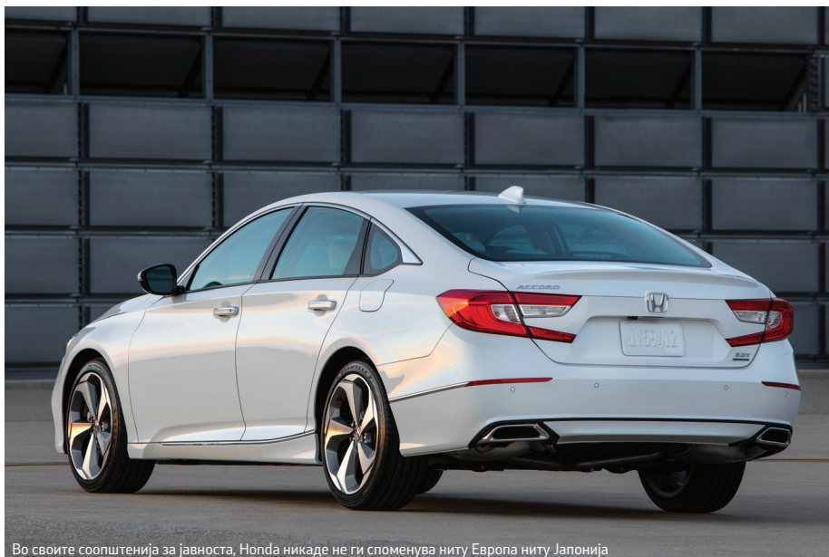
Во своите соопштенија за јавноста, Honda никаде не ги споменува ниту Европа ниту Јапонија

на оваа таму популарна лимузина ѝ овозможува нов пазарен пристап. Драматично обликувана, таа ќе се обиде да раскине со досегашното позиционирање на моделот