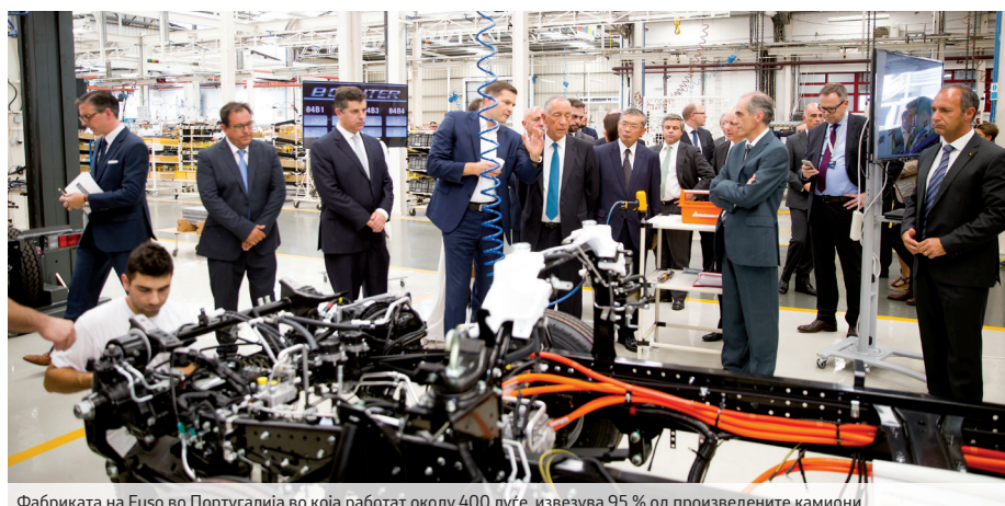
Фабриката на Fuso во Португалија во која работат околу 400 луѓе, извезува 95 % од произведените камиони

ограничувања во поглед на бучавата и загадувањето. Plus, тој е и многу економичен во споредба со конвенционалните камиони со слични перформанси. Камионот eCanter има пониски оперативни трошоци за околу 1.000 евра на секои 10.000 поминати километри. Има автономија од околу сто километри кои ја обезбедуваат шест блока литиум-јонски батерии со напон од 420 V и капацитет од по 13,8 kWh секој. Во зависност од конфигурацијата и изведбата, носивоста му изнесува помеѓу два и три тони. Значајно е и тоа што батериите се од сопствено производство и доаѓаат од фабриката на Daimler во Каменц, Германија, кој е сопственик на 89,3 % од Mitsubishi Fuso Truck and Bus Corporation. До крајот на годината е планирано да се произведат 150 примероци од овој 7,5-тонски камион.