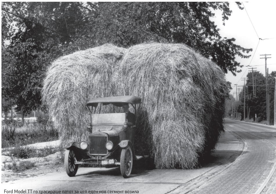
Ford Model TT го трасираше патот за цел еден нов сегмент возила

канците. Идејата на Хенри Форд беше да се направи лесен фармерски камионет со отворен товарен дел каков што дотогаш немаше. Беше наречен Model TT и беше заснован на суперуспешниот Model T, но имаше поцврсти шасија и задна оска кои му обезбеду-