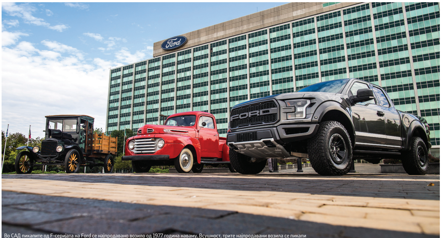
Во САД пикапите од F-серијата на Ford се најпродавано возило од 1977 година наваму. Всушност, трите најпродавани возила се пикапи

До Втората светска војна во Ford беа направени преку 4 милиони пикапи, кога производството премина на воен режим, исклучиво за потребите на армијата. Цивилното производство се врати во 1947 година, а во 1965 година беше понуден првиот пикап од F-серијата, која се произведува и ден-денес. Иако моментално во глобален подем, пикапите во Европа никогаш не се ни доближија на славата што ја имаа во остатокот од светот – за купувачите на Стариот Континент повеќе одговараа доставните возила, кои Ford ги има од сите категории и големини.