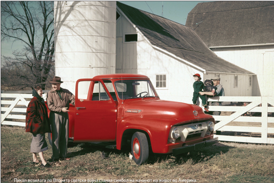
Пикап возилата по Втората светска војна станаа симбол на начинот на живот во Америка

ри), до 1926 година се намали на 325 долари. Најголема заслуга за тоа имаше порастот на производството, кое од неколку десетици илјади примероци годишно до 1925 година се искачи на повеќе од 300 илјади. Во 1928 година беше заменет со многу успешниот Model AA.