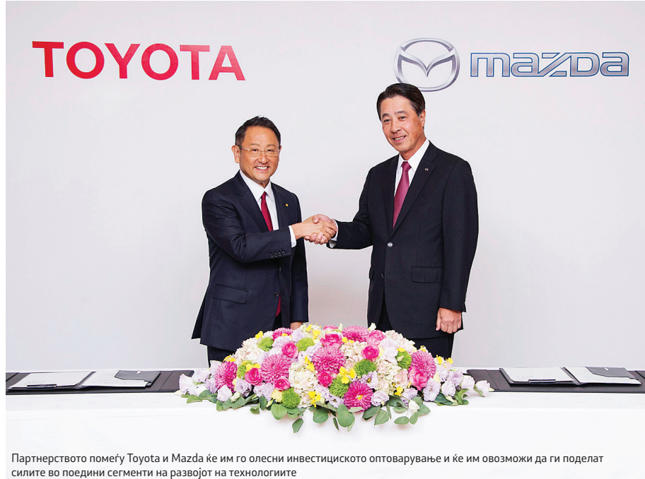
Партнерството помеѓу Toyota и Mazda ќе им го олесни инвестициското оптоварување и ќе им овозможи да ги поделат силите во поедини сегменти на развојот на технологиите

Соработката меѓу двајцата јапонски производители се проширува и продлабочува