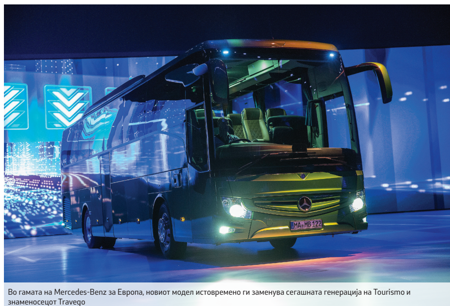
Во гамата на Mercedes-Benz за Европа, новиот модел истовремено ги заменува сегашната генерација на Tourismo и знаменосецот Travego

Во развојот на новата генерација автобуси од туристичката класа, Mercedes-Benz инвестираше 400 милиони евра